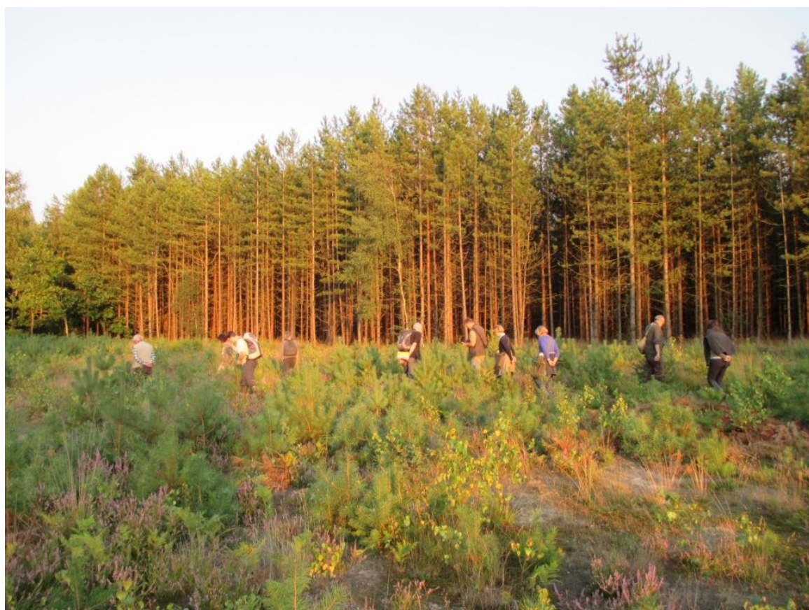
een kudde grazende slobkousen