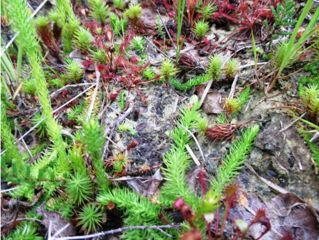
Moeraswolfsklauw en kleine zonnedauw